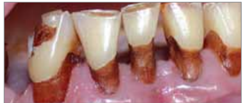
15 mois après le traitement.