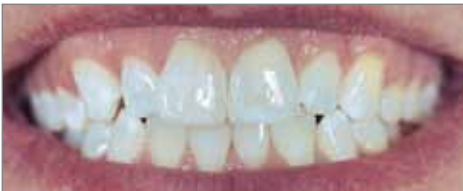
Aussitôt après le blanchiment initial avec une coloration des dents encore apparente.

"La coloration des dents était très nette mais après le traitement une amélioration esthétique et un résultat acceptable ont été obtenus".