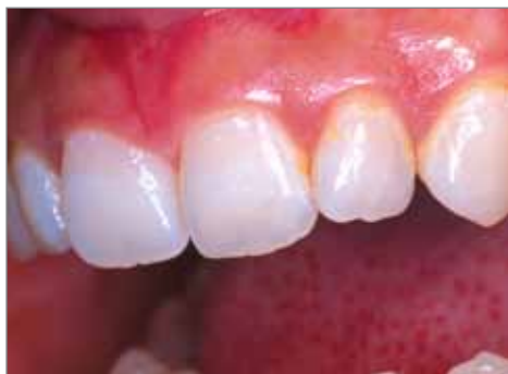
Résultats obtenus au bout d'un mois d'application bi-quotidienne de 5 minutes.