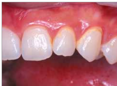
Après 3 mois.

Afin d'éviter les tâches blanches, il est recommandé d'appliquer Tooth Mousse deux fois par jour pendant toute la durée du traitement et également en cas d'appareil extra oral.