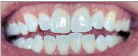
Deux semaines après le blanchiment final et 2 applications quotidiennes de Tooth Mousse .

"La coloration des dents était très nette mais après le traitement une amélioration esthétique et un résultat acceptable ont été obtenus".