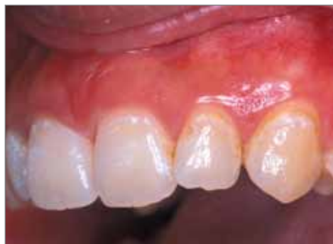
Aussitôt après le retrait des brackets.

RECALDENT™ CPP-ACP a montré de réels effets sur les tâches de décalcification visibles chez les patients qui ont suivi un traitement orthodontique. Cette série de photo clinique a été réalisée par un orthodontiste qui a utilisé une pâte contenant 5% RECALDENT™ CPP-ACP à la suite du retrait des brackets.