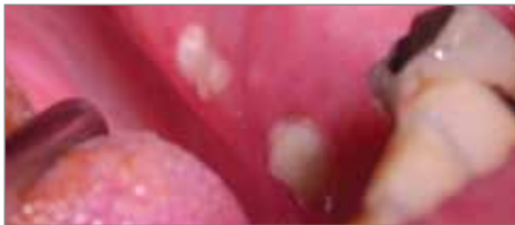
Séquelle osseuse - Traitement post-radiation.