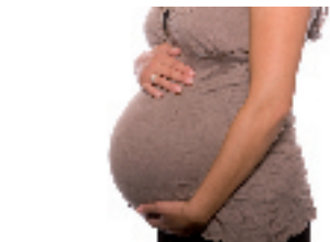
Future maman ? Protégez-vous contre l'érosion et les sensibilités avec MI Paste Plus

Recaldent® est utilisé sous licence Recaldent® Pty Limited. Recaldent® CPP-ACP est un dérivé sans lactose de la caséine de lait de vache. Il ne doit pas être utilisé chez les patients allergiques aux protéines de lait de vache et / ou aux hydroxybenzoates.