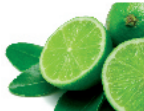
Boissons gazeuses, régime acide ou sucré ? Protégez et renforcez les dents avec MI Paste Plus

Source: S. Kariya, et col., The 82nd General session of the IADR, 2004