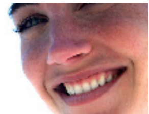
Blanchiment ? Réduisez la sensibilité avec MI Paste Plus