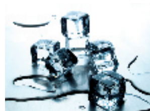
Sensibilité dentaire ? Réduisez toute sensibilité avec MI Paste Plus