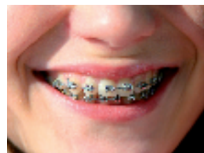
Traitement orthodontique ? Prévenez les tâches de décalcification avec MI Paste Plus